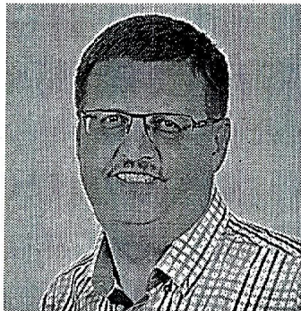
Popovics György (Fidesz-KDNP), a megyei közgyűlés elnöke

– A megyei önkormányzat által koordinált Terület- és Településfejlesztési Program (TOP) keretében Mogyorósbányán uniós forrásból többek között vízkárelhárítási munkálatokba kezdenek – jelentette be Popovics György, a megyei közgyűlés elnöke. A 200 millió forintos projekt keretében megvalósul az Alkotmány utca és Petőfi utca által határolt terület vízrendezése is. A házi- és gyermekorvosi rendelő épülete 41,5 millió forintból megújul. A beruházás során a tető javítására, utólagos hőszigetelésre, az épület vizes blokkjainak, elektromos hálózatának és nyílászáróinak tel-